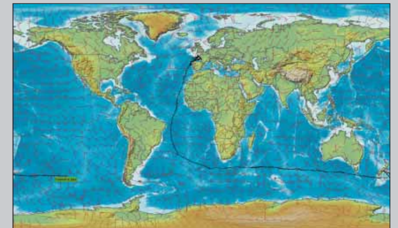
Balise. Carte à jour du 30 janvier 2008, qui retrace les positions de Fréquence Jazz depuis son départ de Port-Médoc.

Par Jean-Luc Gourmelen.